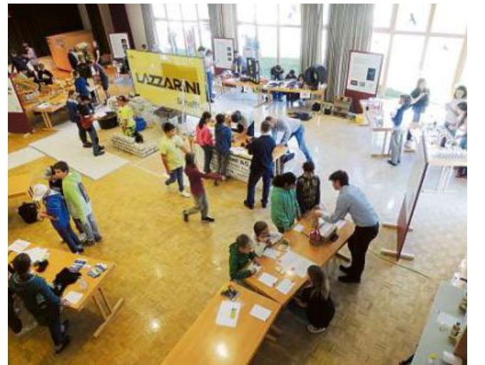
In venderdi passo es steda la prüma faira da maisas, organiseda da la ditta Inavaunt.